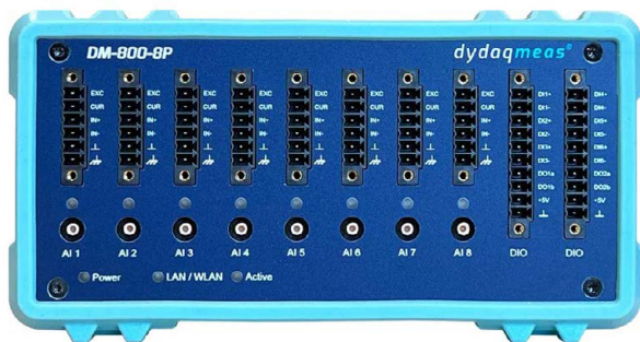
dydaqmeas mit 8 analogen Eingängen, digitalen I/O und leistungsfähigem ARM® Prozessor

Jedes dydaqmeas Messsystem ist gleichzeitig ein leistungsfähiger Edge Computer mit integriertem Webserver. Alle Funktionen sind über die moderne Weboberfläche in einem Browser einzurichten und zu verwalten. Über individuell gestaltete Dashboards können die Messdaten überall auf der Welt in einem Webbrowser angezeigt werden.